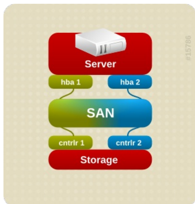
图 1.3. 带一个 RAID 设备的主动/主动多路径配置